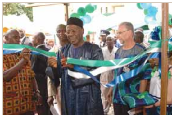
Mehr als 500 Frauen wurden seit der Eröffnung der MercyShips-Klinik von ihrer Fistel befreit.

Über 200 Gäste waren versammelt, um das erste Jahr des Klinikbetriebs zu feiern – ehemalige Patientinnen sowie Gäste aus dem In- und Ausland.