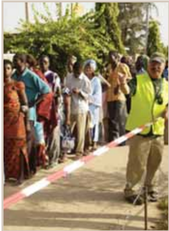
Hoffnung auf Hilfe – Mehr als 2000 Menschen kamen zu den Untersuchungstagen in Ghana.

Heute möchte ich Sie wieder einmal darüber informieren, wie es mit unserer Arbeit in Afrika aussieht.