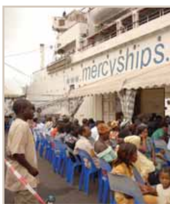
Die Patienten warten darauf, von den Ärzten untersucht und auf die Krankenstation aufgenommen zu werden.

Zukunft kostenlose Operationen anbieten können. Um den Einsatz erfolgreich zu beenden, benötigen wir noch rund 220.000 Euro.