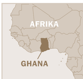
Die Anastasis besuchte Ghana bereits in den Jahren 1991 und 1994-95.