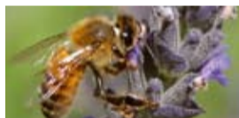
Das Bienenprojekt wird in Kooperation mit dem ghanaischen Forstamt durchgeführt.

Mercy Ships hält derzeit Ausschau nach Bienen, und zwar nach einigen Millionen afrikanischer Honigbienen. 52 Frauen aus Ghana wurden nämlich im Rahmen eines Förderungsprojektes zu Imkerinnen ausgebildet.