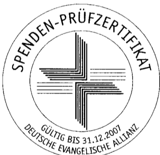
Ihre Judith Beyer

Wir brauchen gerade an Weihnachten Ihre Hilfe. Viele Menschen warten noch darauf, an Bord versorgt und behandelt zu werden. Ihre Spende hilft dabei, Leben zu retten. Und umso mehr, wenn sie in diesem Monat verdoppelt wird!