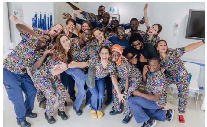
Foto: Ganz schön verrückt – der „Funky Scrubs Friday“ auf den Hospitalschiffen.

Auf unseren Hospitalschiffen gibt es ein paar lustige Traditionen und Bräuche. Der sogenannte „Funky Scrubs Friday“ – frei übersetzt „Freitag der flippigen Kittel“ ist ein fester wöchentlicher Bestandteil auf den Schiffen. Langweilige OP-Kluft wird kurzerhand durch bunte OP-Kleidung getauscht. Ganz schön verrückt, oder?