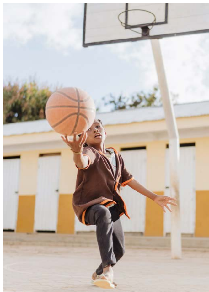
Foto: Annica liebt Basketball – nach der Operation kann sie sich nun wieder frei bewegen.